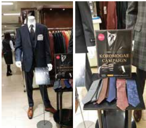
※画像は昨年のものです。