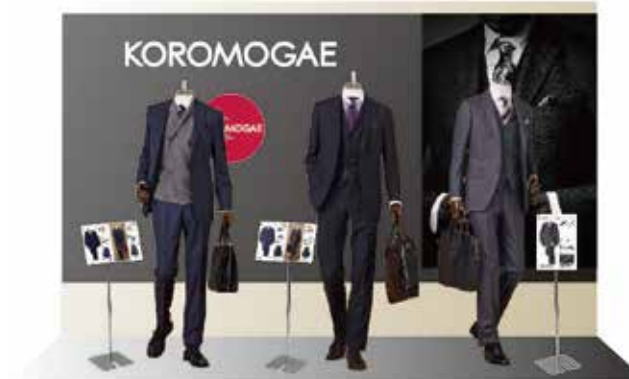
※画像は展示イメージです。

メンズフロアのVPスペースやショーウィンドウ、催事スペースなどで、来店者に向けKOROMOGAE参加ブランドの共同展示提案を行う。（時期や場所などに関しては、協力百貨店様にて決定）