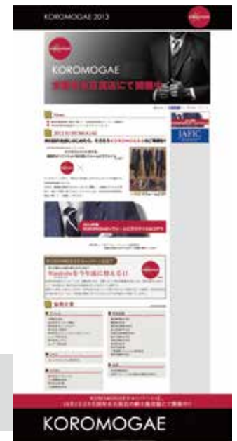
※画像は昨年度のイメージ