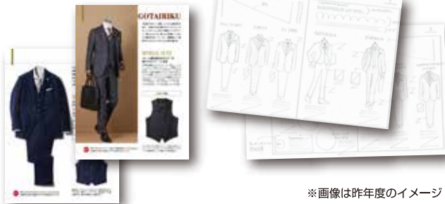
※画像は昨年度のイメージ

キャンペーンのターゲットであるビジネスマンに向けた雑誌でのスタイリング提案で、実需への繋がりを期待