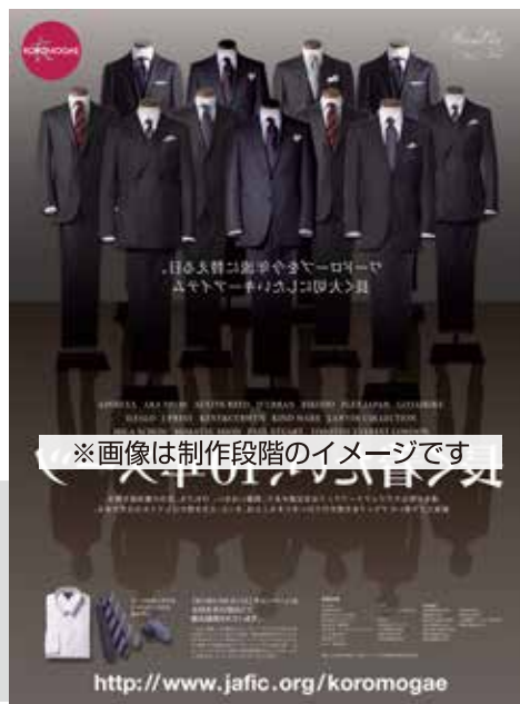
《広告ビジュアルイメージ》