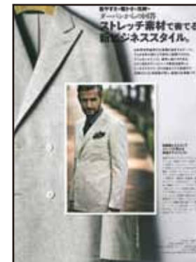
[レナウン D'URBUN 広告]