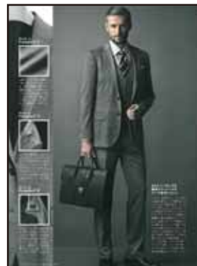
[レナウン D'URBUN 広告]