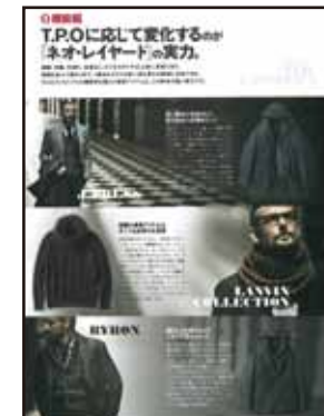
[特集/ネオレイヤード・機能編]