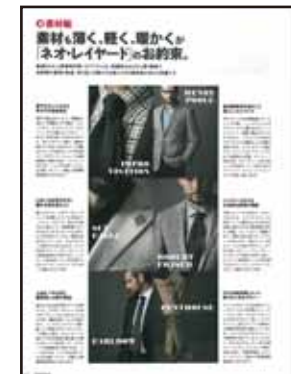
[特集/ネオレイヤード・素材編]