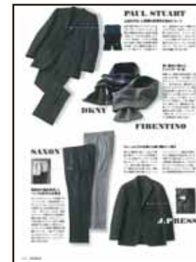
[特集/ネオレイヤード・機能編]