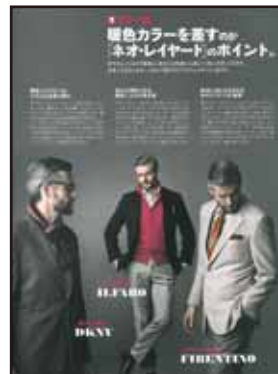
[特集/ネオレイヤード・カラー編]