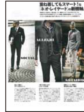
[特集/ネオレイヤード・スタイリング]