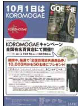
〔オープンキャンペーン募集〕

昨年度より継続して 白洋舎より掲載依頼。 クリーニング店でも、 KOROMOGAE を訴求。