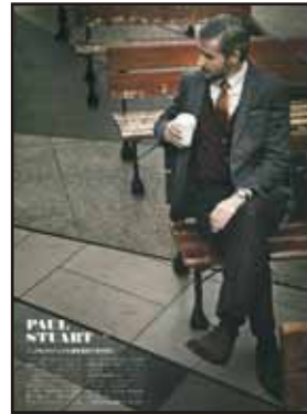
[SANYO SHOKAI 広告]