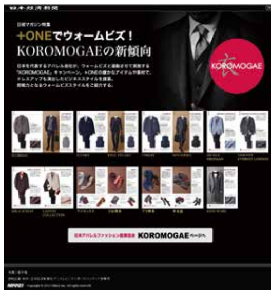
KOROMOGAEキャンペーンサイトへの リンクバナー掲載