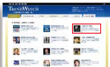
TOPページ、企画特集ページに リンクバナー掲載