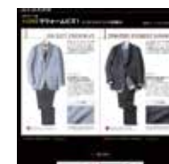
TIMOTHY EVEREST LONDON HICKEY FREEMAN