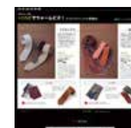
三松商事 アイネックス