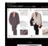
LANVIAN COLLECTION MILA SCHON